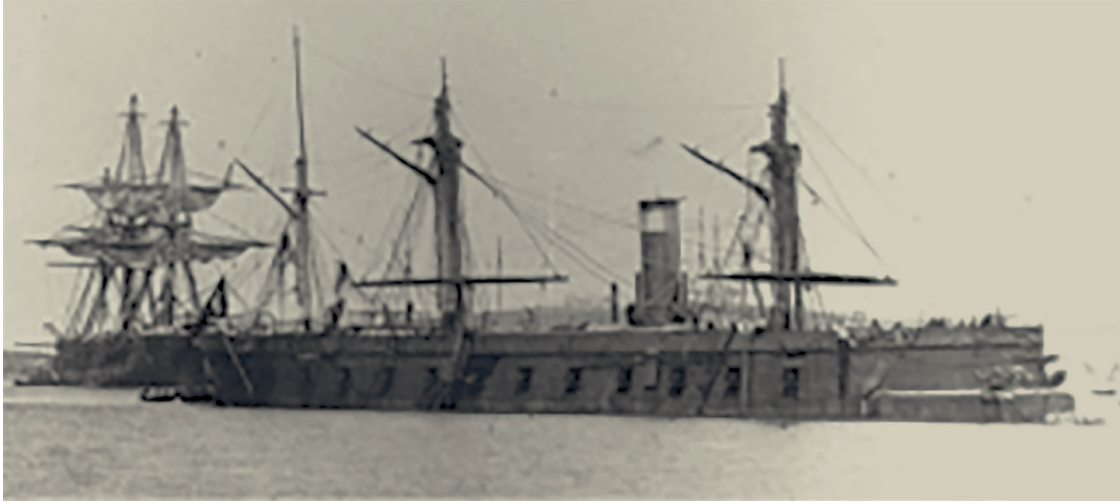
Ek 2: Drache Borda Bataryalı Zırhlı Firkateyni (Avusturya Donanması) 28