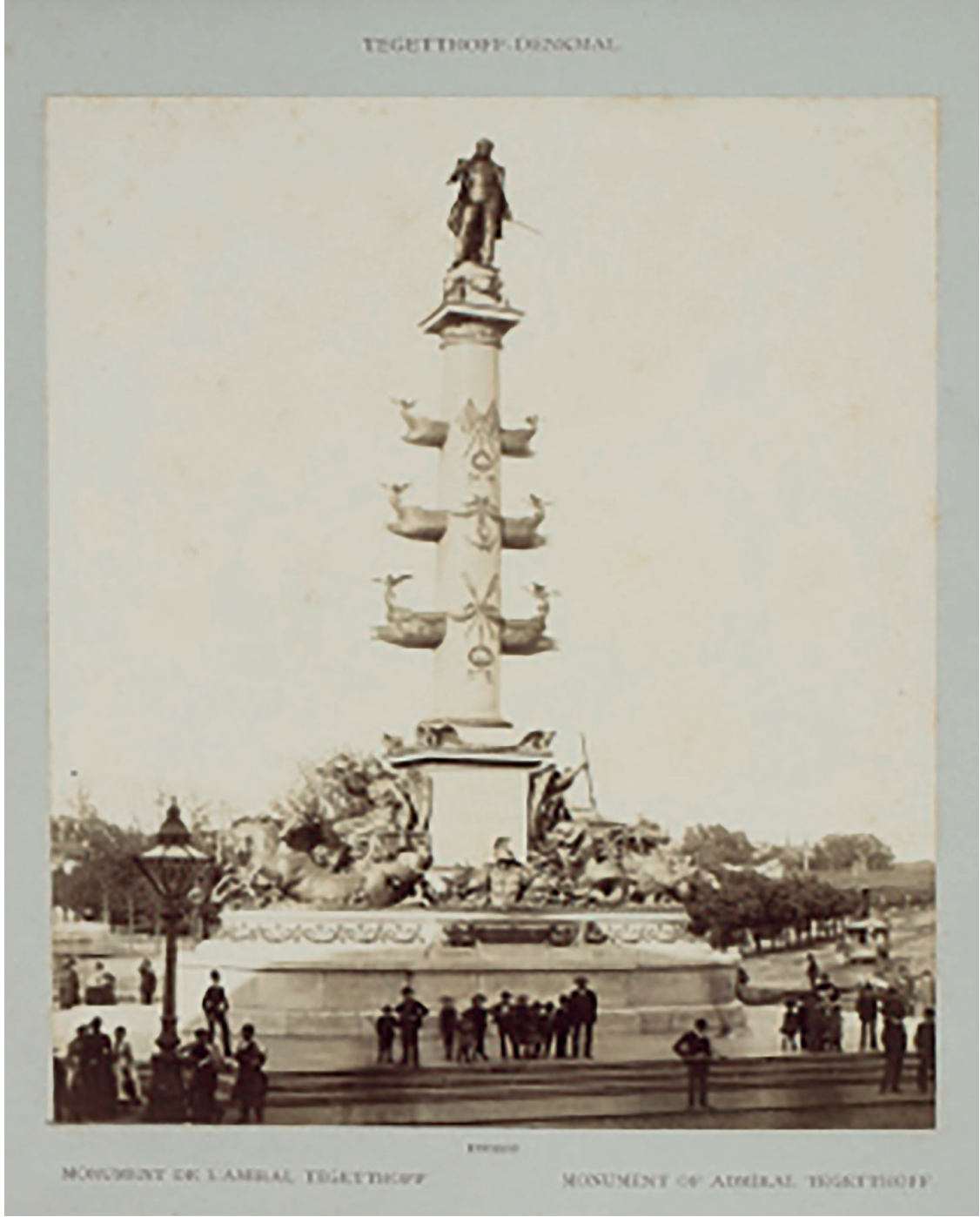
Ek 5: Avusturya Donanması Kumandanı Amiral Tegetthoff'un, Lissa Zaferi Anısına Viyana'da İnşa Edilmiş Olan Heykeli 31