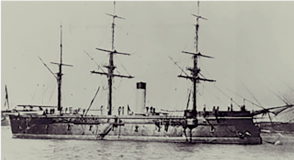
Ek 3: Erzherzog Ferdinand Max Borda Bataryalı Zırhlı Firkateyni (Avusturya Donanması) 29