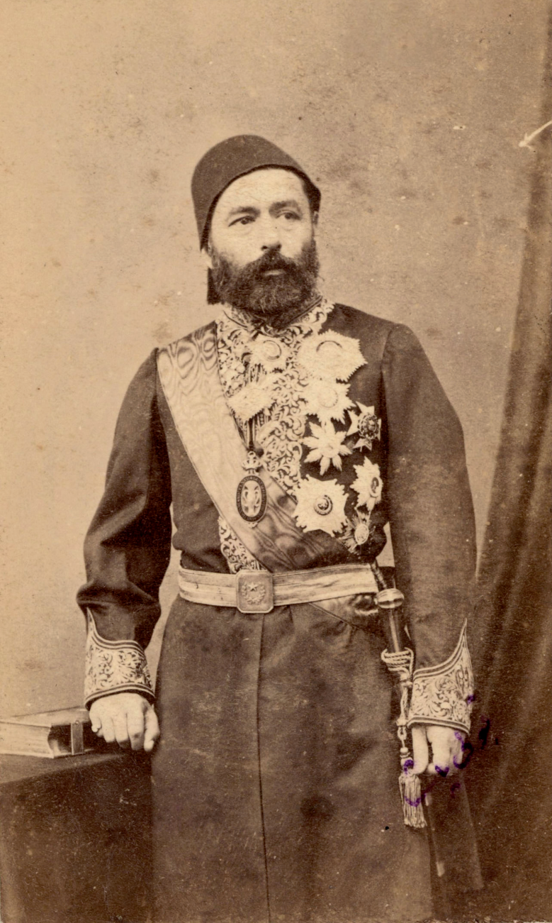
Resim 2: Petersburg Büyükelçisi Mehmed Kabûlî Paşa'nın resmi. Abdullah Biraderler Koleksiyonu. ( https://www.archives.saltresearch.org/R/-?func=dbin-jump_full&object_id=3726995&silolibrary=GEN01 . Erişim Tarihi: 04/02/2017).