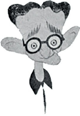
Resim 3: Reşid Halid Gönç'ün en beğendiği karikatürü. Cemal Nadir imzalı. (Her Gün, 2 Şubat 1966, s. 6)

Çocukken geçirdiği çene rahatsızlığı hayatında derin izler bırakmıştır. Özel kliniklerde tedavi görse de sola çarpık şekilde ancak kaynatılabilen çenesi hayatının ayrılmaz parçası olmuş, karikatüristlerin verdiği kıvrımla hafızalara kazınmıştır. 36 Vücudunun en belirgin kısmında oluşan bu arıza, kendisini karamsarlığa sürükleyen aksaklıkların başında gelmektedir. Fakat ilerleyen yaşında bu arıza onun için tatlı bir mizah vesilesine dönüşmüştür. 37