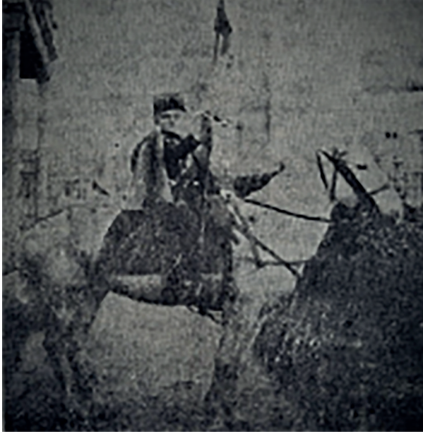
Resim 2: Reşid Halid Gönç, çocukluğunda at sırtında ( Her Gün , 2 Şubat 1966, s. 6)

Tedavi için Paris'e gidiş iznini fırsata çeviren Reşid Halid Bey İstanbul'a hemen dönmemiş, Fransa'da iki buçuk yıl kalmıştır. Paris'teki tedavi sırasında tahsiline Faure mektebinde devam etmiştir. II. Meşrutiyet'in ilanı üzerine İstanbul'a dönmüş, eğitimini Kadıköy'deki Fransız Frères Mektebi'nde (Saint Joseph Koleji) sürdürmüştür. 15