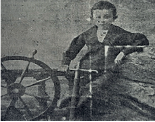
Resim 1: Reşid Halid Gönç'ün çocukluğu ( Her Gün , 2 Şubat 66, s. 6)

zamanının zihniyetinin çok ötesindedir. Reşid Halid Bey'in muallimleri arasında Muallim M. Cevdet gibi devrinin kıymetli maarifçileri bulunmaktadır. 12